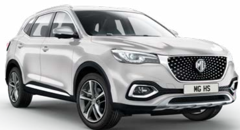
STŘÍBRNÁ MEDAL SILVER METALICKÁ