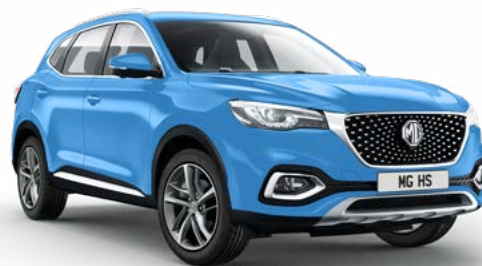
MODRÁ BRIGHTON BLUE STANDARDNÍ