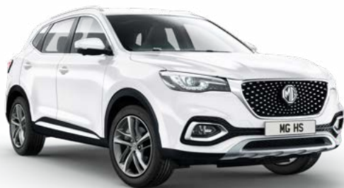
BÍLÁ DOVER WHITE STANDARDNÍ

Podle vašeho vkusu. Vybírejte z řady oblíbených vitálních barev a povrchových úprav, které uspokojí vkus každého zájemce.