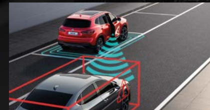
Adaptivní tempomat (ACC)*

Paket MG Pilot zahrnuje špičkové technologie na podporu řízení a dodává tak kýženou jistotu za volantem. Řidiči pomáhá sestava výstražných funkcí k zajištění bezpečnosti a zjednodušení každodenního cestování.