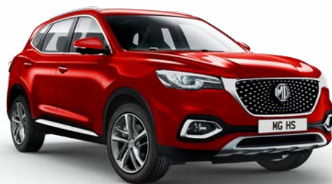
ČERVENÁ DIAMOND RED METALICKÁ