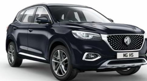
ČERNÁ PEBBLE BLACK METALICKÁ